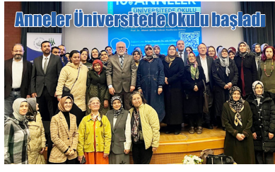
Anneler Üniversitesinde Okulu başladı