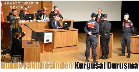
Hukuk Fakültesinden Kurgusal Duruşma