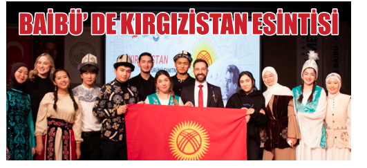
BAİBÜ'DE KIRGIZISTAN ESİNTİSİ